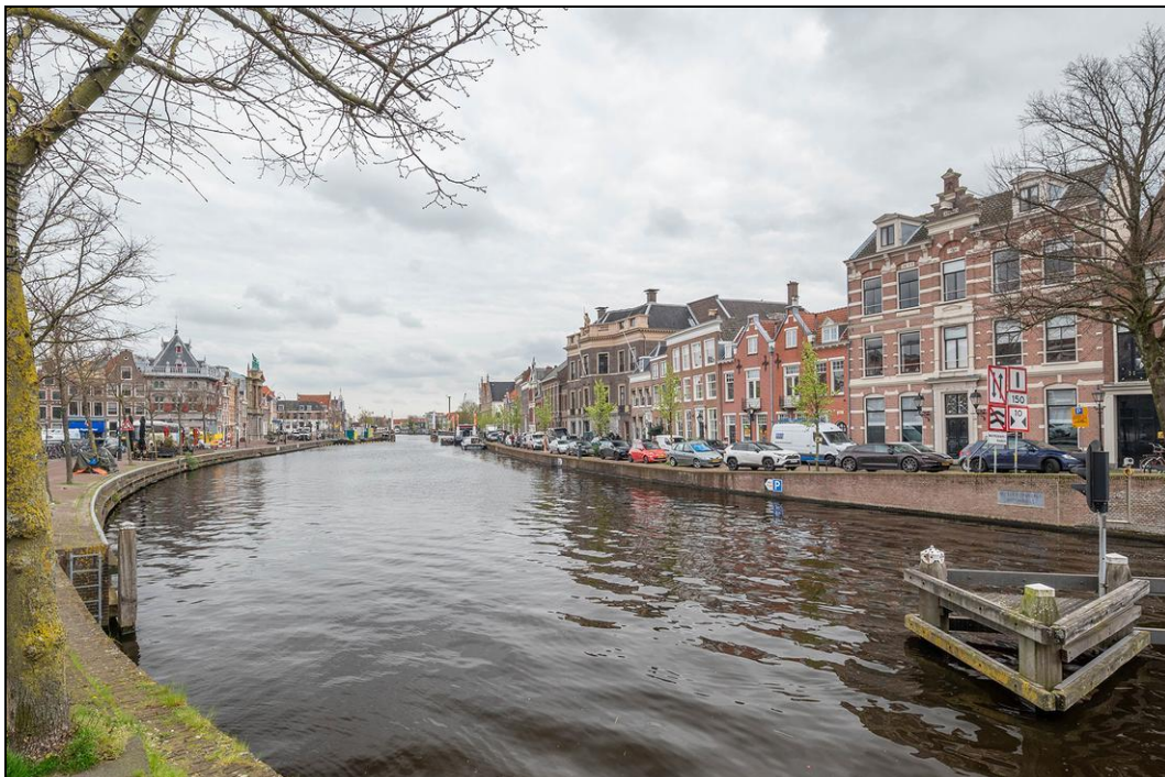
Spaarne 29 B - 2011 CD Haarlem