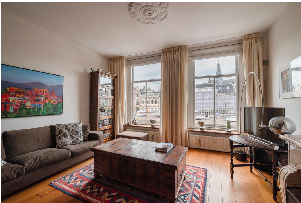
Spaarne 29 B - 2011 CD Haarlem