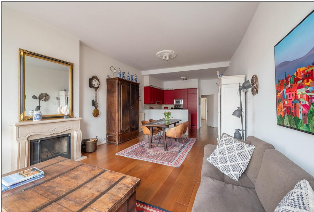
Spaarne 29 B - 2011 CD Haarlem