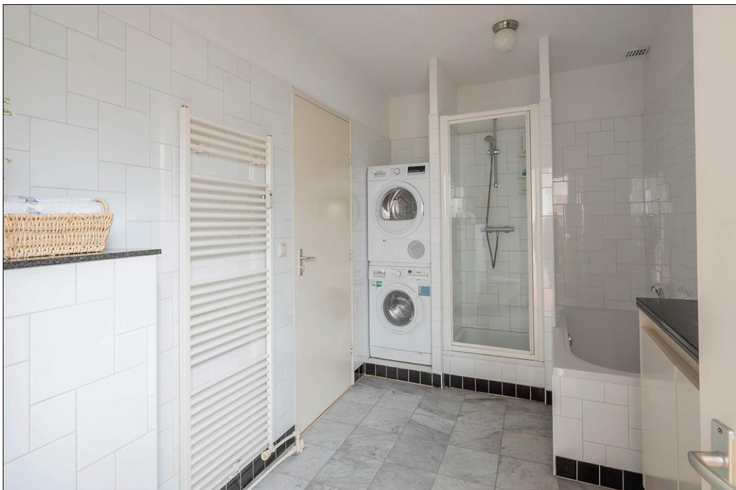
Spaarne 29 B - 2011 CD Haarlem