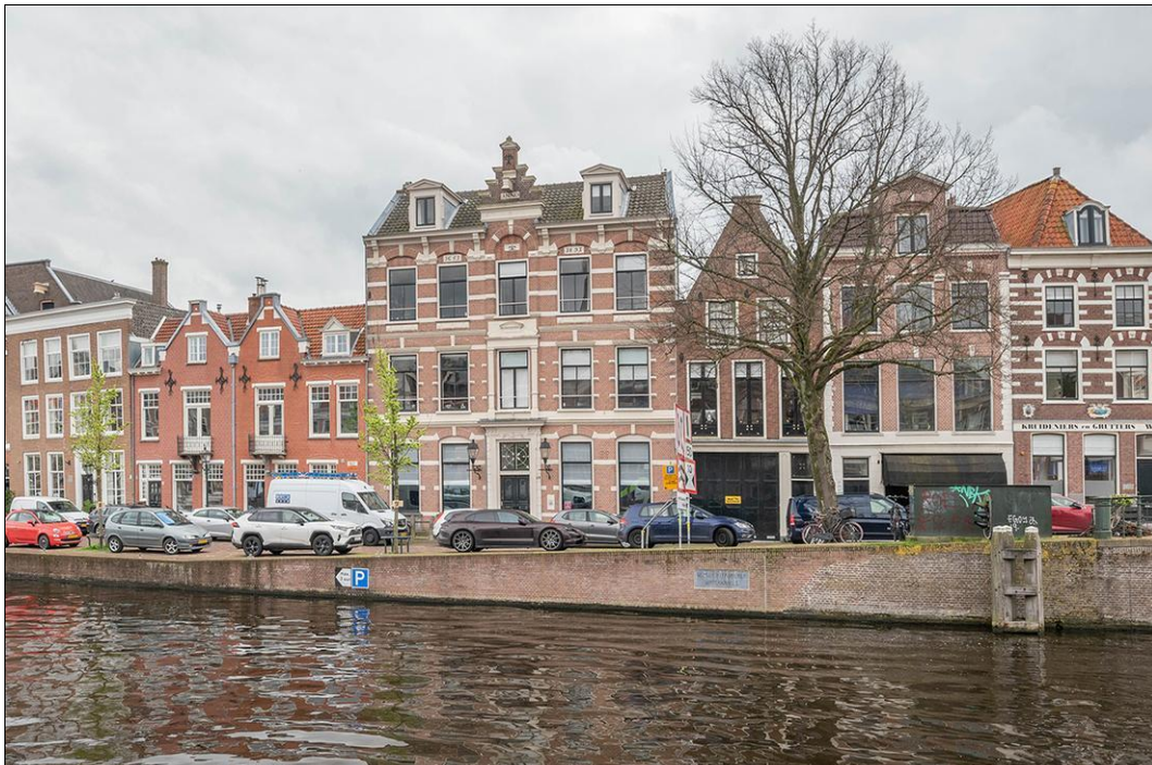
Spaarne 29 B - 2011 CD Haarlem