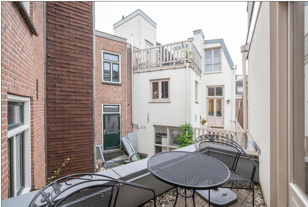
Spaarne 29 B - 2011 CD Haarlem