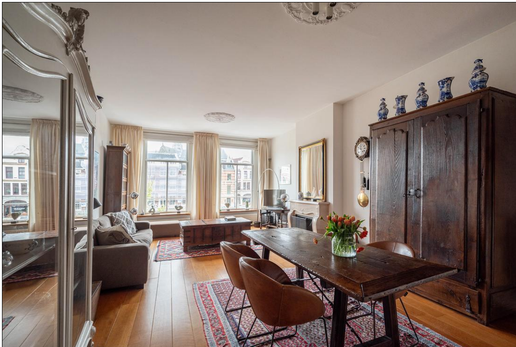
Spaarne 29 B - 2011 CD Haarlem