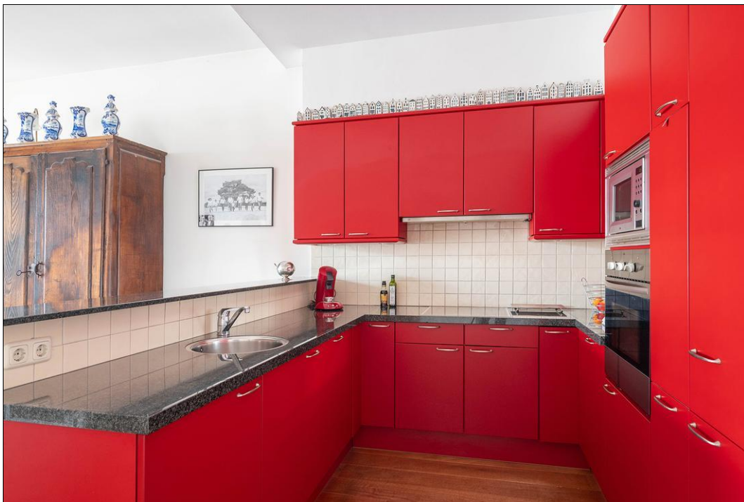
Spaarne 29 B - 2011 CD Haarlem