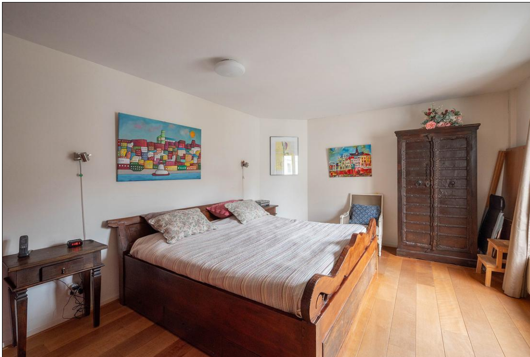
Spaarne 29 B - 2011 CD Haarlem